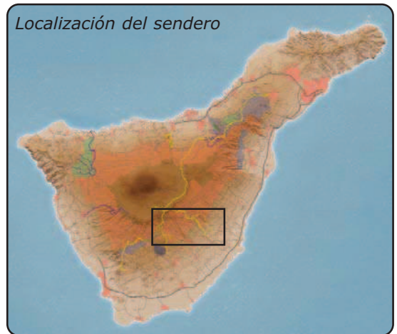
Localización del sendero

Cómo llegar: Villa de Arico y Arico Viejo se encuentra en la carretera TF-28, a la que puede acceder desde la autopista TF-1, por las salidas señalizadas.