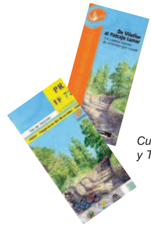
Cuadernillo y Topografía

El sendero PR - TF 72 parte de Vilaflor de Chasna y asciende hasta las cercanías de Los Escurriales, enclave popularmente conocido como Paisaje Lunar. Este recorrido forma parte del Camino de Chasna, una de las vías de comunicación más importantes de Tenerife hasta la llegada de las carreteras.