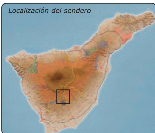
Localización del sendero