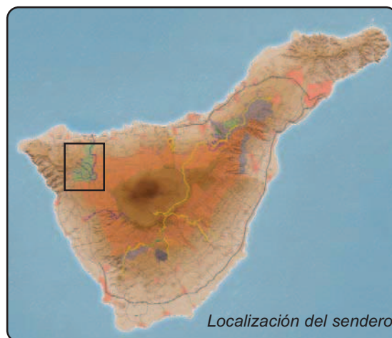
Localización del sendero

Cómo llegar: Tome la autopista TF-5 y su continuación TF-42 para llegar a Garachico. Desde el sur, llegará a través de la TF-82, que pasa también por San Juan del Reparo y Santiago del Teide. Por último, de la TF-82 sale un desvío a la TF-373, que pasa por La Montañeta, San José de Los Llanos y Los Partidos de Franquis.