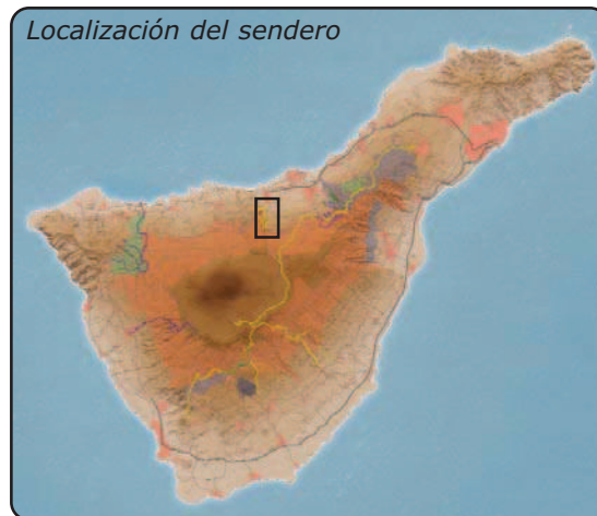
Localización del sendero

Cómo llegar: Para llegar a El Realejo Alto, deberá tomar la salida nº 39 de la autopista TF-5, y seguir la señalización hasta la iglesia de Santiago Apóstol. Si opta por comenzar en Chanajiga, deberá tomar la carretera TF-326 hasta Las Llanadas y, una vez allí, tomar la pista asfaltada según la señalización.