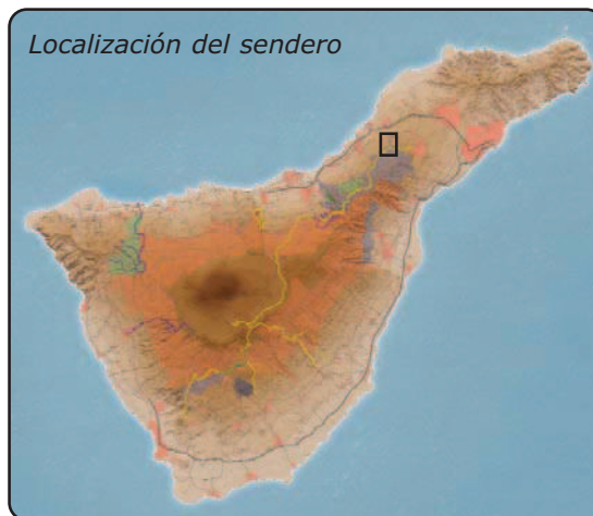
Localización del sendero

Cómo llegar: En el barrio de Agua García, tome la carretera que conduce hacia La Esperanza. En pocos minutos, encontrará una curva donde deberá desviarse a la derecha por la calle Madre del Agua. Al final de ésta se encuentra el punto de inicio.